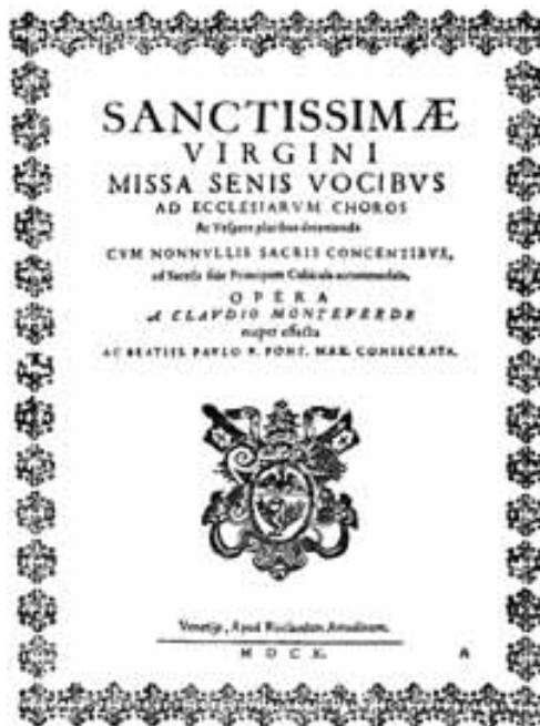
Titelblatt des Erstdruckes